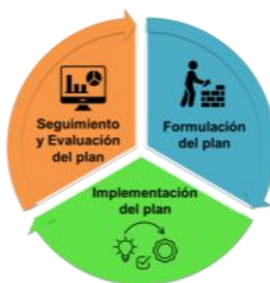
Ilustración 1. Ciclo de Planificación