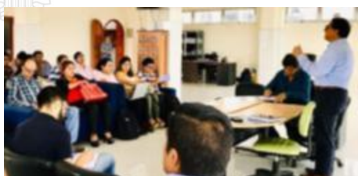
Taller con GAD de la provincia de Napo