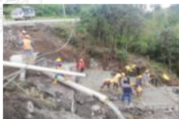
Obra Vialidad – Baeza – Cotundo, en ejecución