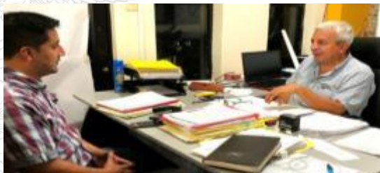
Reunión de trabajo con técnicos del GADM Puerto