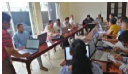
Taller con GAD de la provincia de Orellana