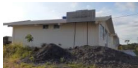
Obra de Salud – CDS 24 de Mayo – Dahuano, detenido

Elaboración: Coordinación Zonal de Planificación 2