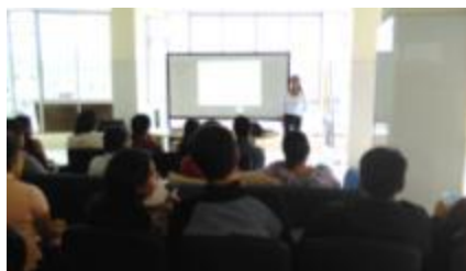
Taller con GAD de la provincia de Napo