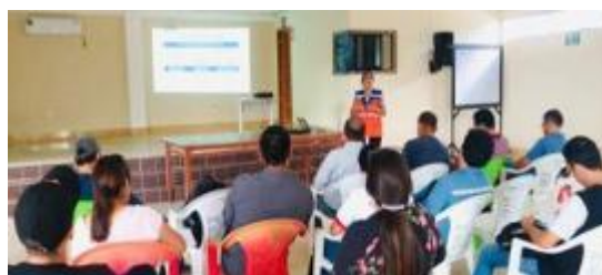
Taller con GAD de la provincia de Orellana