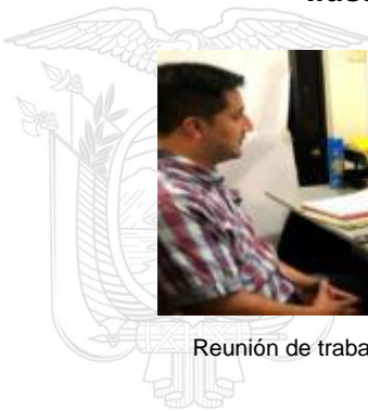
Ilustración 3. Seguimiento a competencias de GAD Municipales

Seguimiento al ejercicio de las competencias de agua potable y saneamiento ambiental en los GAD Municipales de Mejía, Pedro Moncayo, Cayambe, San Miguel de los Bancos, Pedro Vicente Maldonado y Puerto Quito (Pichincha), Arosemena Tola y Quijos (Napo), en estas visitas técnicas se constató las iniciativas y obras que ejecutan los GAD para ampliar la cobertura de los servicios señalados, orientados a mejorar las condiciones de vida de la población.