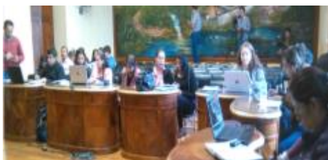
Taller con GAD de la provincia de Pichincha

Elaboración: Coordinación Zonal de Planificación 2