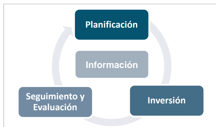
Gráfico 1. Ciclo de Planificación